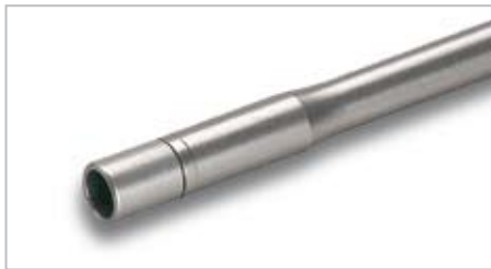
Manipolo per Sbiancamento